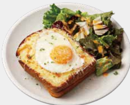
CROQUE MADAME クロックマダム 1,300 (税込 1,430)