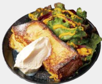
FRENCH TOAST w/ maple cream 厚切りフレンチトースト メープルホイップ添え 1,150 (税込 1,265)