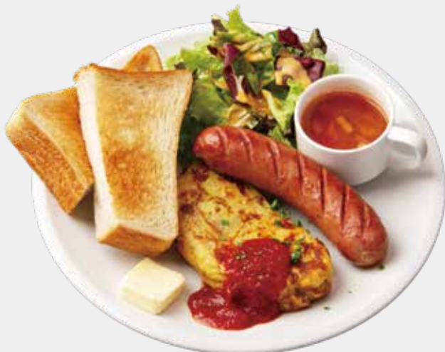
SPANISH OMELETTE & SAUSAGE PLATE スペインオムレットと 信州粗挽きソーセージのプレート 2,200 (税込 2,420)