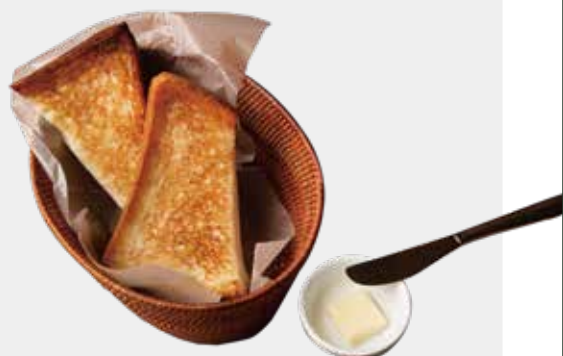
THICK SLICED TOAST 日替わり厚切りトースト 600 (税込 660)